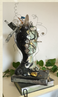
Le Anatomie della Mente"

COMUNE DI FERRARA BIBLIOTECA COMUNALE ARIOSTEA