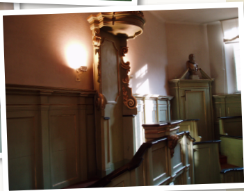
Immagini attuali del teatro Anatomico di Palazzo Paradiso

Nel trasferimento dalla sede originaria delle Crocette di San Domenico al Palazzo Paradiso (1567) si rese necessaria la costruzione di un primo teatro anatomico, dedicato alle dissezioni a scopo didattico frequentate dagli studenti, che contribuirono alle spese per la sua costruzione rinunciando, come risulta dalle cronache, ai soldi destinati alle feste carnevalesche. Fu soltanto nel 1731, grazie all'Anatomico Giacinto Agnelli e all'Architetto Francesco Mazzarelli, che fu approntato il Teatro Anatomico esistente, a pianta ottagonale, con entrate separate per gli studenti, il docente ed il cadavere, illuminato da quattro grandi finestre. Per circa un secolo il teatro Anatomico svolse la sua funzione originaria, fino al 1831 quando la sede della Facoltà di Medicina dell'Università di Ferrara fu trasportata presso l'Arcispedale S. Anna di Corso della Giovecca.